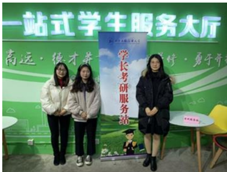
图 4.2 研究生社会实践活动“考研服务站”

结合研究生特点，发挥学术活动和社会实践在研究生思想政治教育中的育人作用，设立考研服务站，为有意愿考研的本科生提供咨询服务；成功举办研究生阳光体育运动会、研究生科技文化节系列活动、研究生素质拓展活动、篮球联赛、校园歌手大赛、摄影大赛等。