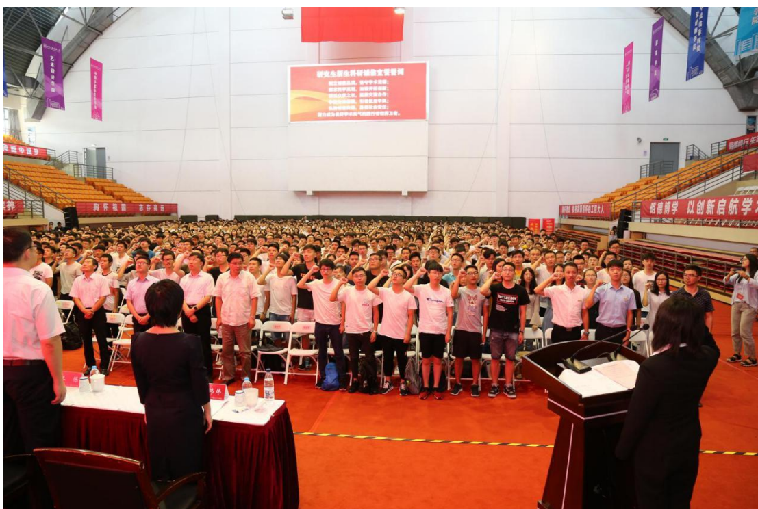
图 6.2 研究生科学道德和学风建设主题教育系列活动

2018-2019 学年，学校在教育内容和形式上不断丰富并创新。学校实施基于工科研究生的学术道德和学风建设引领计划，积极探索创新研究生科学道德和学风建设教育形式，遴选校内品德高尚、学术造诣深厚、为人师表的知名教授，以科学精神、科学道德、科学伦理和科学规范作为主要内容，围绕“立德·立学·立信”“讲诚信·守底线·树新风”等主题，面向全校研究生，开展专家报告、集中学习、主题党日等研究生科学道德和学风建设主题教育系列活动，通过主题活动、报告会等方式将活动特色进行展示宣传。该活动项目已成功连续举办多年，共涉及全校 12 个学院 3200 余名学生，覆盖率 100%，各学院结合研究生思想政治教育工作计划，根据学院学科专业特点，积极探索创新研究生科学道德和学风建设教育形式，每年约举办 30 多场科学道德和学风建设宣讲教育活动，深化教育效果。