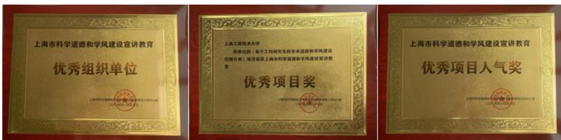
图 6.3 “基于工科研究生的学术道德和学风建设引领计划”获奖情况