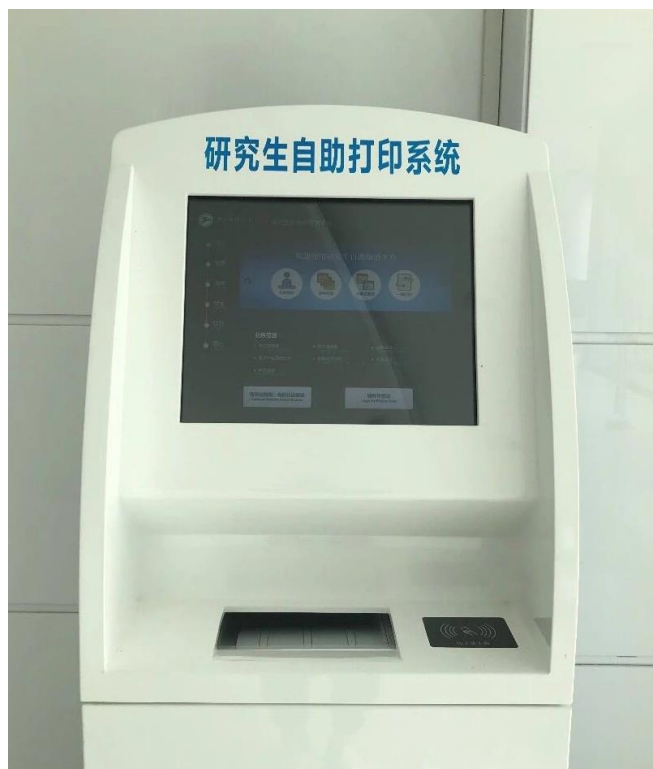
图 6.5 研究生自助打印系统

规章制度模块为我校研究生相关管理制度，该模块能帮助研究生迅速掌握研究生相关管理制度，按照时间结点和要求，规范办理各项业务。