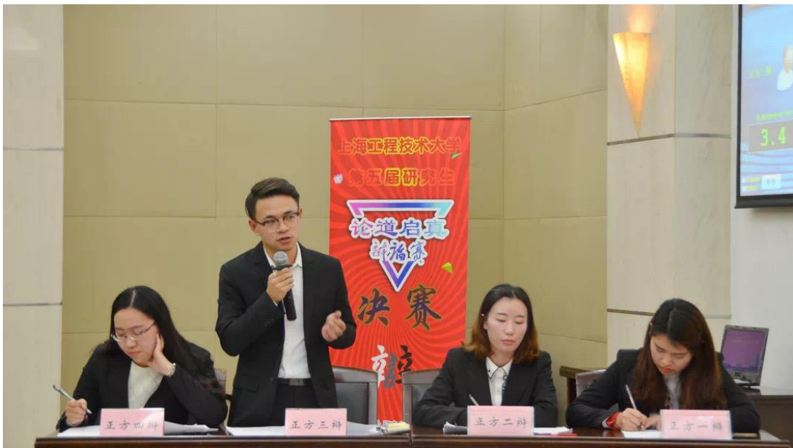
图 4.1 校级研究生品牌学术活动“研究生论道启真辩论赛”

结合研究生特点，发挥学术活动和社会实践在研究生思想政治教育中的育人作用，设立考研服务站，为有意愿考研的本科生提供咨询服务；成功举办研究生阳光体育运动会、研究生科技文化节系列活动、研究生素质拓展活动、篮球联赛、校园歌手大赛、摄影大赛等。