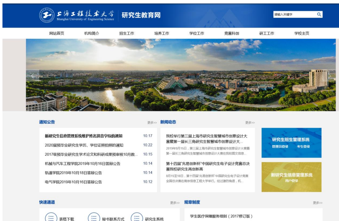
图 6.4 研究生处网站截屏图

新版的研究生教育网站于 2019 年正式投入使用，新版界面内容更清晰，布局更合理，涵盖“机构简介、招生工作、培养工作、学位工作、竞赛科创、研工工作”六个板块，实现了服务功能师生化、界面设计人性化、信息结构多元化的设计目标和理念，使得我校研究生教育网得以快速全新呈现。截屏如图 6.4 所示。