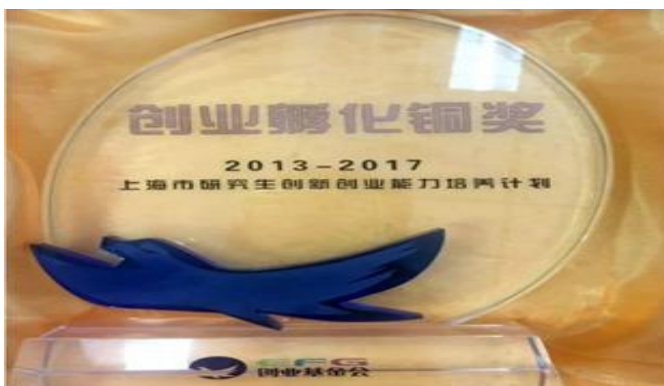
图 4.3 上海市研究生创业孵化铜奖

(2) 成功申请研究生创新创业培养专项项目。从 2013 年开始，上海市学位办与上海市大学生科技创业基金会联合开展研究生创新创业培养专项项目，该项目旨在促进高校创新成果与技术转化，提高研究生创新创业能力，对立项研究生开展为期 6 个月的创新创业能力培训与创业实践。研究生工作部积极组织和指导研究生申报该项目，2013-2019 年我校共 48 项研究生项目立项，全部通过结题评审，多个项目获得 20-50 万元的天使基金创业资助。2018 年，我校也荣获上海市创业基金会颁发的研究生创业孵化铜奖。通过实施研究生创新创业项目，让研究生熟悉从项目申报、实施、中期检查、结题等的全部流程，充分发挥创新创业项目的育人功能，培养研究生主持项目、团队合作、创新创业等方面的能力。